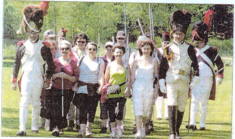
La randonnée à thème a fait le succès du Rando-Moselle de Saint-Quirin.

Le Rando-Moselle, 8 e du nom, aura lieu les 7, 8 et 9 juin à Lettenbach entre Saint-Quirin et Abreschviller. Incontournable pour les amoureux de la marche.